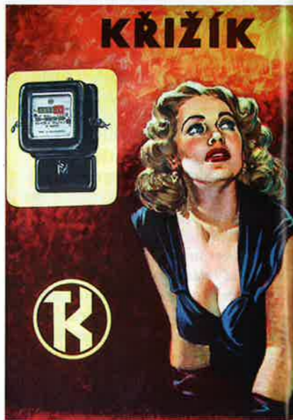
Konečného reklamní plakát z padesátých let

jako zkušeného kreslíře a grafika slyšel, co si myslíte o kvalitě těchto prací. Byly vytvořeny v letech 1960-1966 v SSSR ilegální tvůrčí skupinou 125 mladých umělců. Ti pozoruhodně sovětské rošťáky dokázali něco udělat v rámci romantického žánru. Ve fantasticko-exoticko-erotickém dobrodružství s kozatým vampem Oktabrinou (dříve, v prvních fázích tvorby, ji jmenovali méně nápaditě Aurorou, Amazonou, Tamarou, Mahari), persifluji mládí rebelové všechna tabu