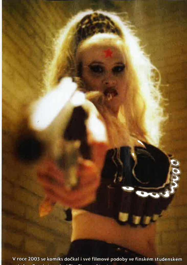
V roce 2003 se komiks dočkal i své filmové podoby ve finském studenském snímku: Octobriana And The Finger of Lenin

Kniha se stala velkou mediální senzací. Vyšly o ní velké články ve světových časopisech, o komiksu referovali poslanci v britském parlamentu, obdivovala jej řada tvůr-