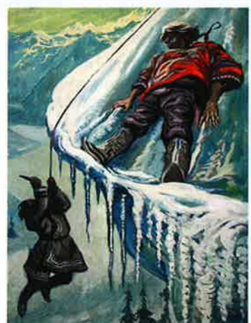
Jeden z originálů knižních ilustrací „vypůjčených“ Sadeckým navždy

jako zkušeného kreslíře a grafika slyšel, co si myslíte o kvalitě těchto prací. Byly vytvořeny v letech 1960-1966 v SSSR ilegální tvůrčí skupinou 125 mladých umělců. Ti pozoruhodně sovětské rošťáky dokázali něco udělat v rámci romantického žánru. Ve fantasticko-exoticko-erotickém dobrodružství s kozatým vampem Oktabrinou (dříve, v prvních fázích tvorby, ji jmenovali méně nápaditě Aurorou, Amazonou, Tamarou, Mahari), persifluji mládí rebelové všechna tabu