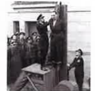
Odsouzen a veřejně popraven 26. ŘÍJNA 1946 v litoměřické věznici.