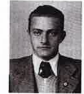
Siegfried Seidl Velitelé terezínského ghetta byli zatčeni v Rakousku. První byl popraven ve Vídni 4. ÚNORA 1947 a druhý 30. DUBNA 1947 v Litoměřicích.